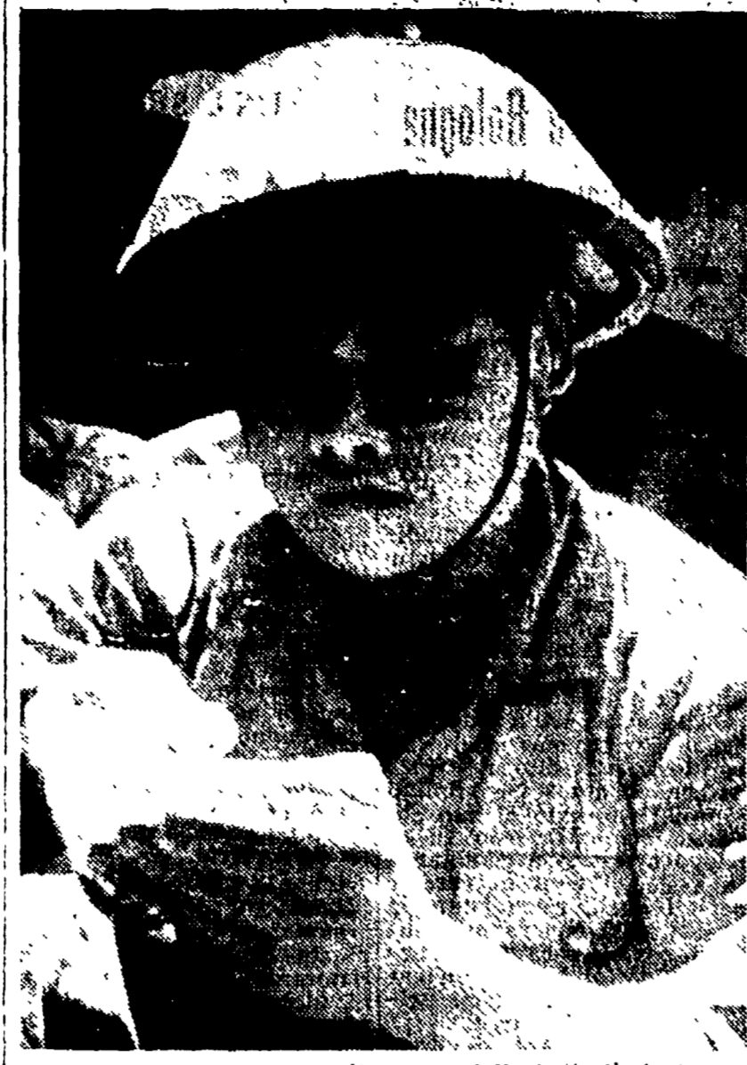
Viet Nam Libero - Nelle pause della battaglia i giovani combattenti dell'esercito popolare si istruiscono e studiano con metodo e coscienza