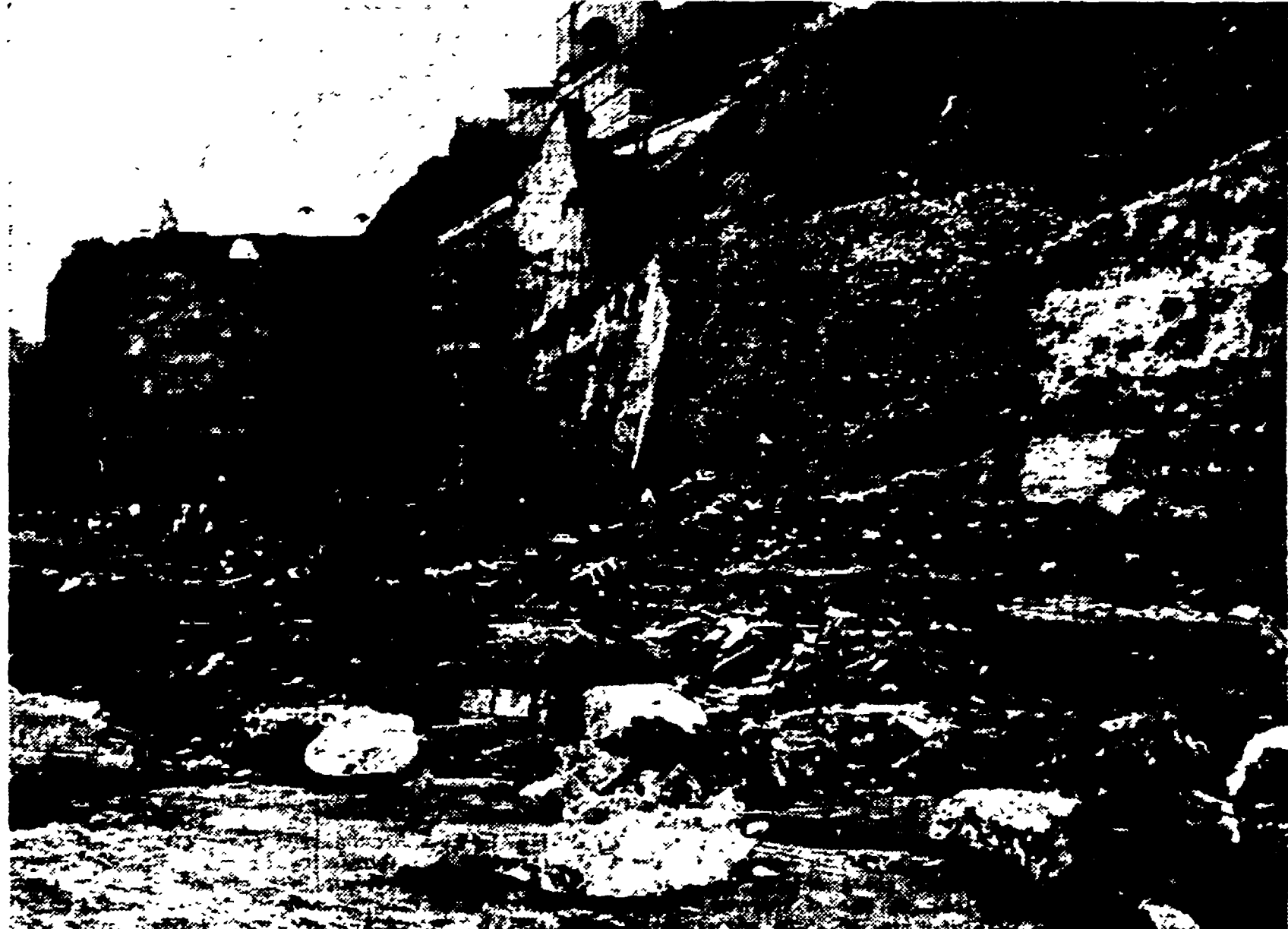
Il crollo delle Mura Vaticane. Il luogo è stato visitato dal sindaco che non ha degnato d'uno sguardo le strade di Trionfale in cui vive assieme alla