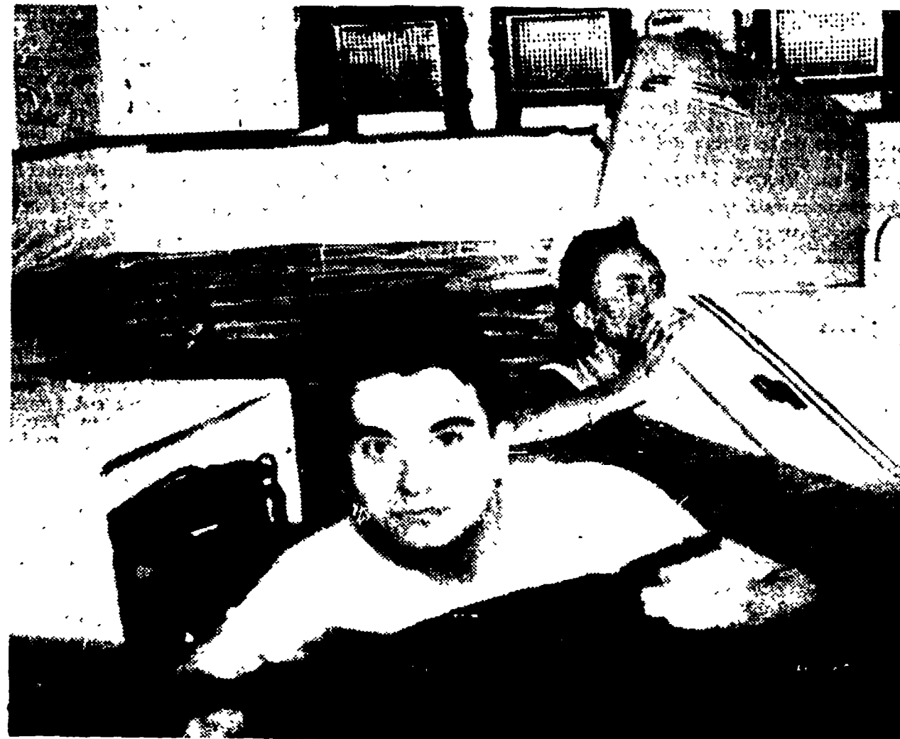
Via del Gambero. Ecco come è stato ridotto il negozio di radioradio ed elettrodomestici «Smira»