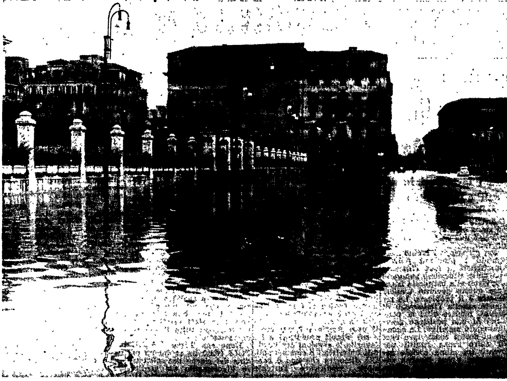
La Via Flaminia è ridotta quale appare nella fotografia, in quale stato siano le borgate è facile immaginare