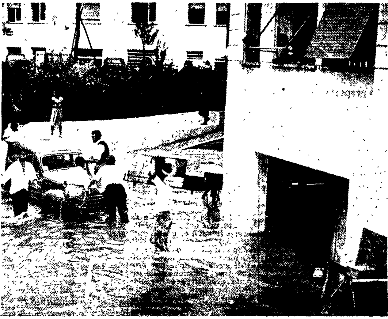
Un negozio di falegnameria a Trionfale invaso dalle acque. Si tenta di salvare i mobili