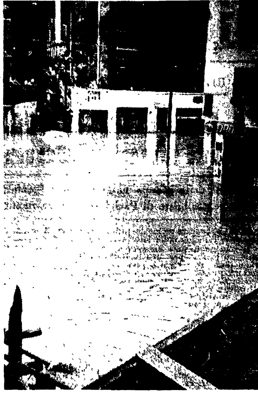
Via Angelo Emo al Trionfale. — Al disotto della scala emerge la «capote» di un'automobile