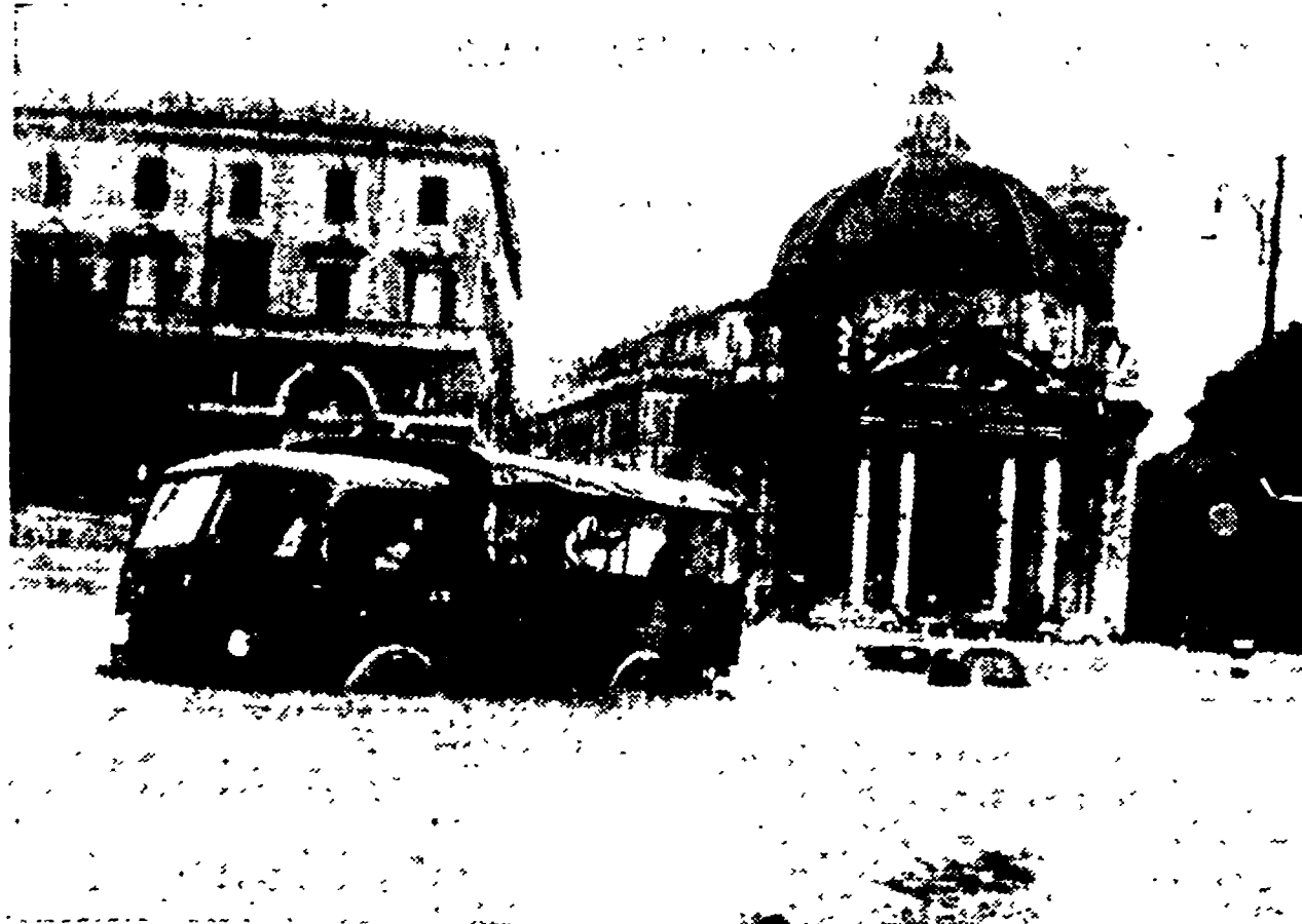
Una visione di piazza del Popolo è di drammatica. Almeno qui, però, non vi sono case allagate e cittadini senza tetto