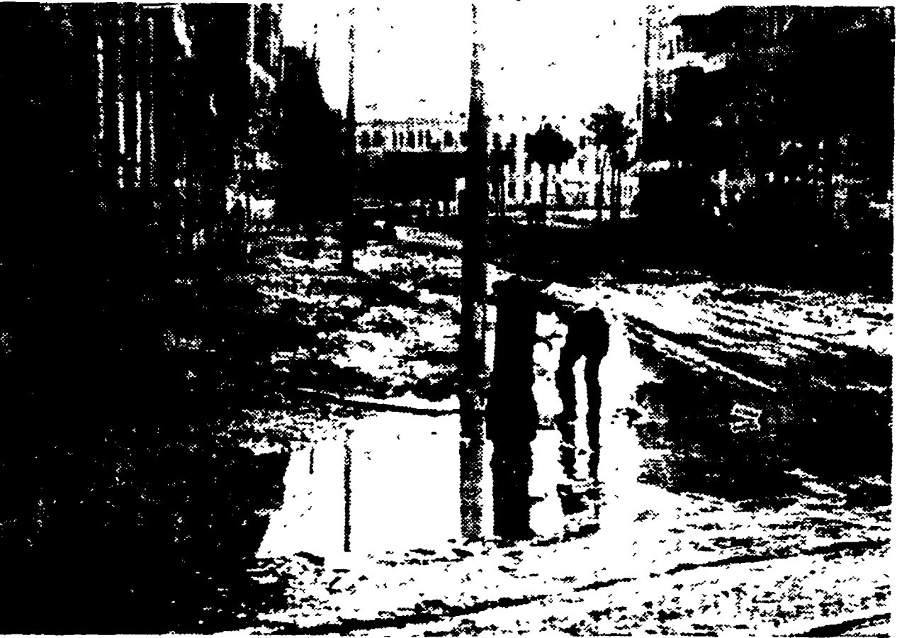
Un desolante aspetto di una delle strade del quartiere Aurilio. Il fango e l'acqua hanno invaso numerose abitazioni della zona