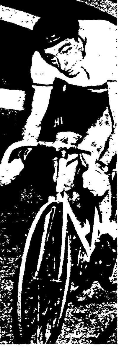
Per COPPI è iniziata ora la serie delle rivalutazioni ai pista