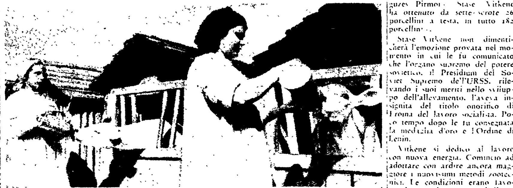
Contadine in camicie bianche nei modernissimi allevamenti zootecnici sovietici