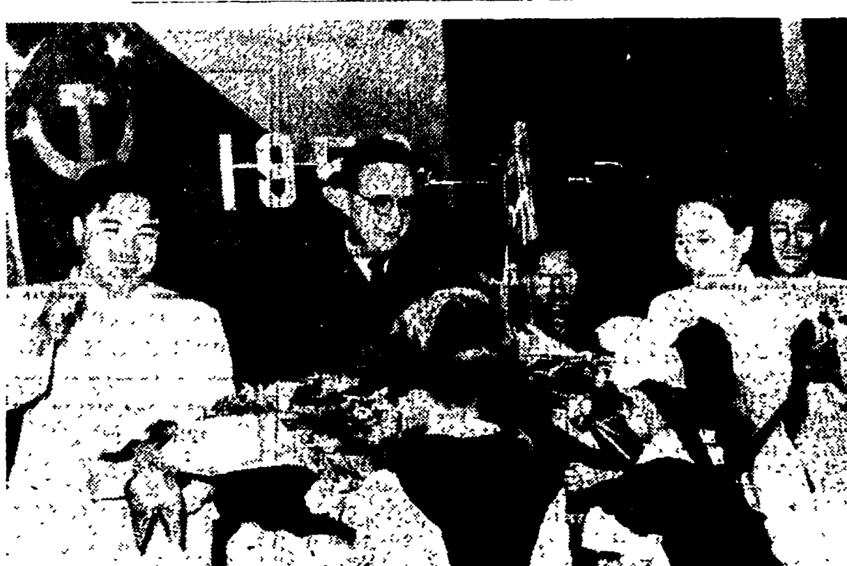
Durante la cerimonia per l'ottavo anniversario della liberazione, due giovani pionieri offrono fiori al maresciallo Kim Il sen e all'ambasciatore sovietico in Corea C. Susdalev

Nuove dichiarazioni del generale americano Dean — Un commento di Radio Pechino alle dichiarazioni del segretario di Stato U.S.A. sull'Indocina e la Corea