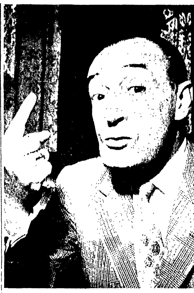
Una tipica espressione di Totò, ovvero il principe De Curtis