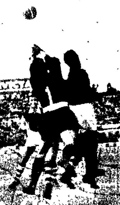
MILAN-PALERMO 4-1 - Pendibene risolve il pugno una mischia pericolosa - (Foto)