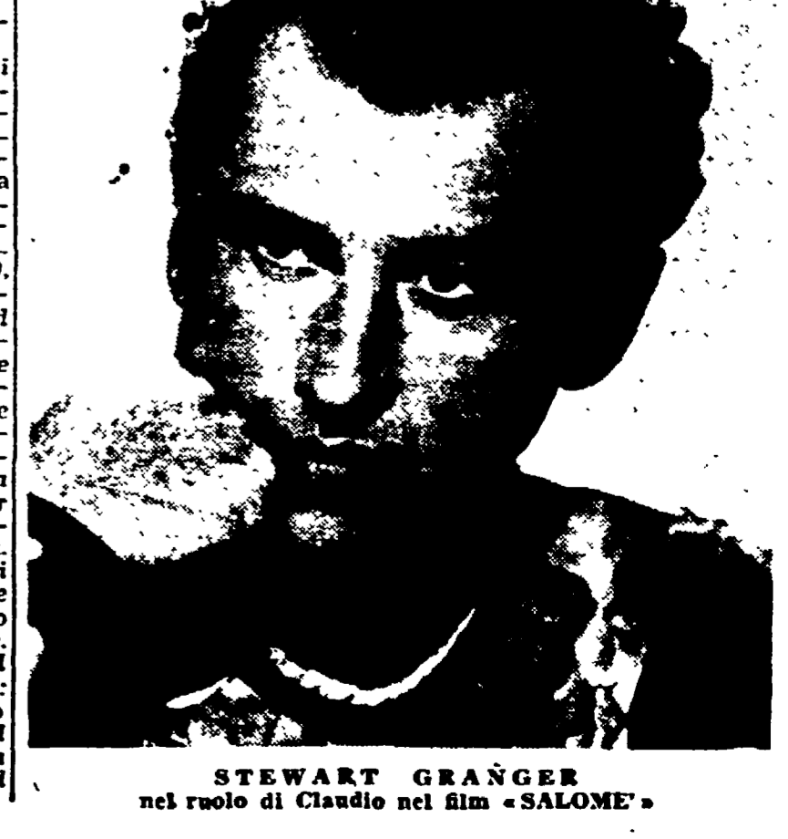
STEWART GRANGER nel ruolo di Claudio nel film «SALOME»

Durante la rappresentazione di un'opera, Mascagni era ospite nel palco di una vecchia dama, la quale, indispettita dal fatto che il maestro affumicasse l'ambiente col sigaro, disse: «Fumate troppo, mio caro; finirete male!». Il maestro rise; come conosceva un tale che pur fumando era arrivato a settant'anni; «La vecchia dama agguaita: se non avesse fumato oggi ne avrebbe 80!».