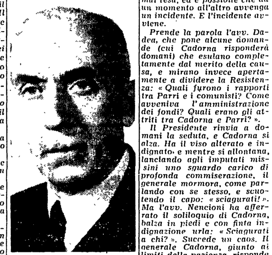
Il generale Cadorna

Si sono concluse ieri notte le trattative in corso presso il Ministero del Lavoro per le trattative in merito alla vertenza sorta da tempo nelle fabbriche del complesso MVI Taddei di S. Giovanni Valdarno, Empoli, Fiesole Valdarno. L'accordo raggiunto, è il risultato dell'efficace azione unitaria dei lavoratori i quali sono riusciti a fare ritirare tutti i licenziamenti richiesti dalla Ditta, a impegnarla per una immediata ripresa della attività produttiva a S. Giovanni Valdarno, e a rinnovare gli impianti meccanizzandoli al fine di riassorbire nel processo produttivo i lavoratori e le fabbriche per un periodo di tre mesi effettuando un corso di qualificazione.