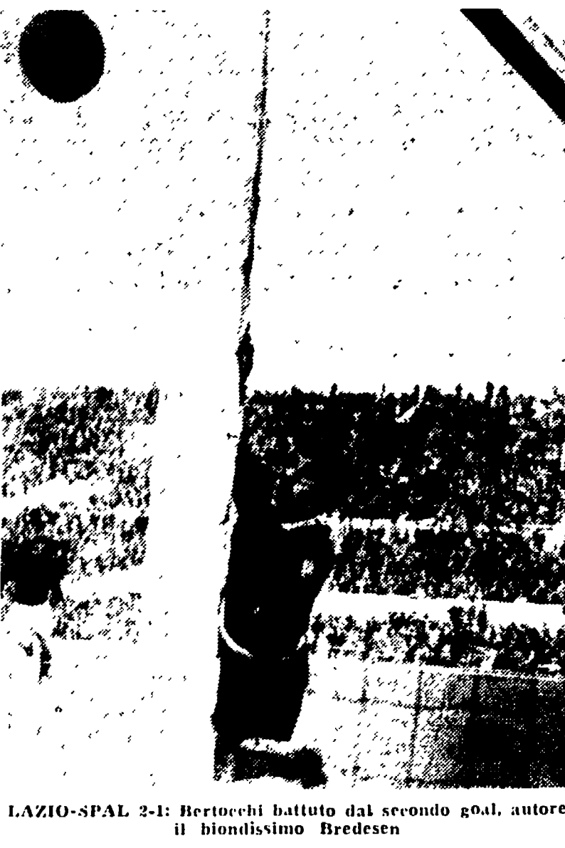
LAZIO-SPAL 2-1: Bertocchi battuto dal secondo goal, autore il biondissimo Bredesen