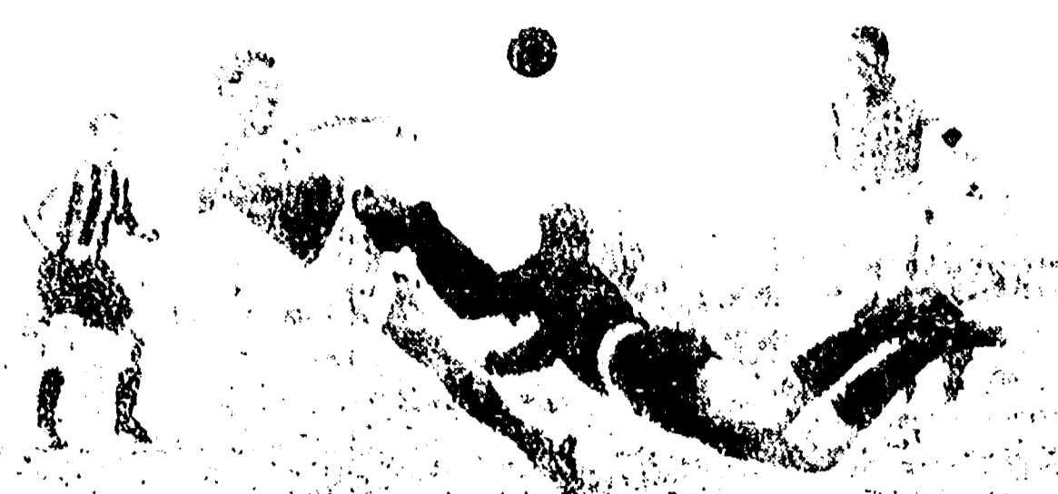
IN UN'AZIONE... I giocatori della Lazio e della Fiorentina si contendono il pallone durante una partita del campionato di calcio.

La Juventus, malgrado la sconfitta di S. Siro, conserva intatte le sue possibilità di vincere il campionato. L'Inter e la Fiorentina confermano la solidità della loro inquadatura. Il Milan non ha convinto del tutto, mentre la Lazio è in ripresa.