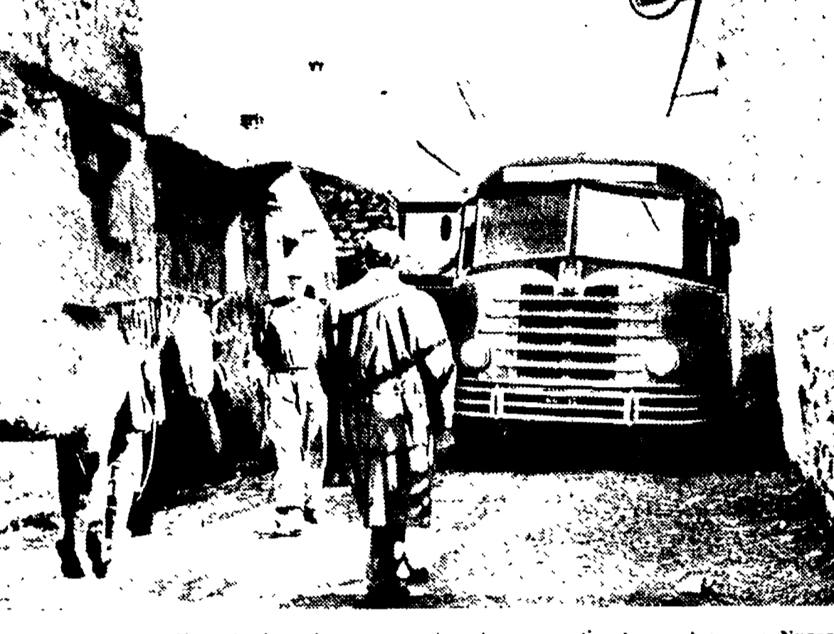
ORGOSOLO - Una strada del paese, mentre sta per partire la corriera per Nuoro

Il sanguinoso conflitto a fuoco sulla strada Nuoro-Lanusei