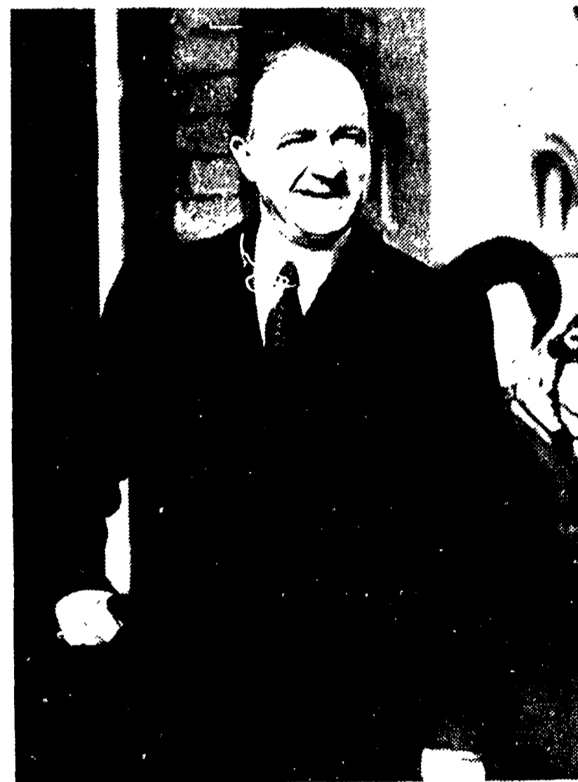
Il Cancelliere dello Scacchiere Richard Butler

LONDRA, 31 - Il Cancelliere dello Scacchiere Butler è partito ieri da Londra per Sydney dove dirigerà la delegazione inglese alla conferenza del Commonwealth che si inizia il 18 gennaio.