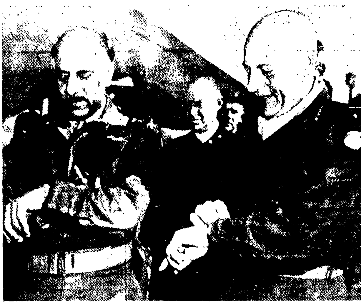
PAN MUN JON — Il generale Thimaya, presidente della commissione neutrale, e il generale Hull, comandante supremo americano, al termine di un lungo colloquio sulla questione dei prigionieri.

IL CAIRO, 4. — Il governo egiziano ha chiesto all'ambasciatore turco al Cairo Husni Yusuf una invitata.