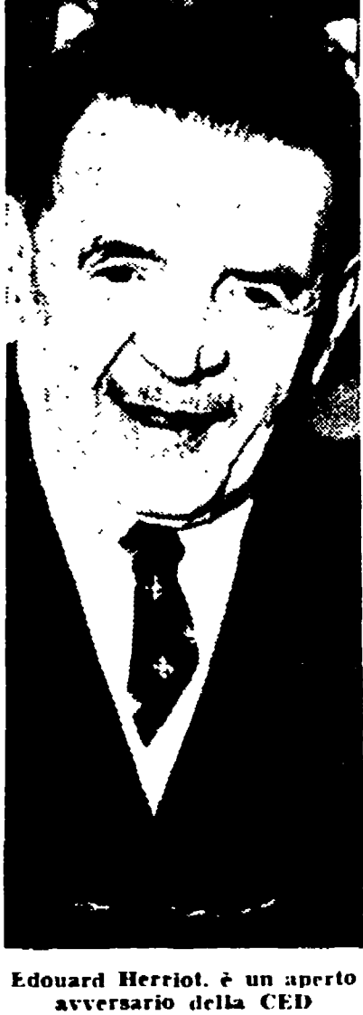
Edouard Herriot, è un altro avversario della CED.