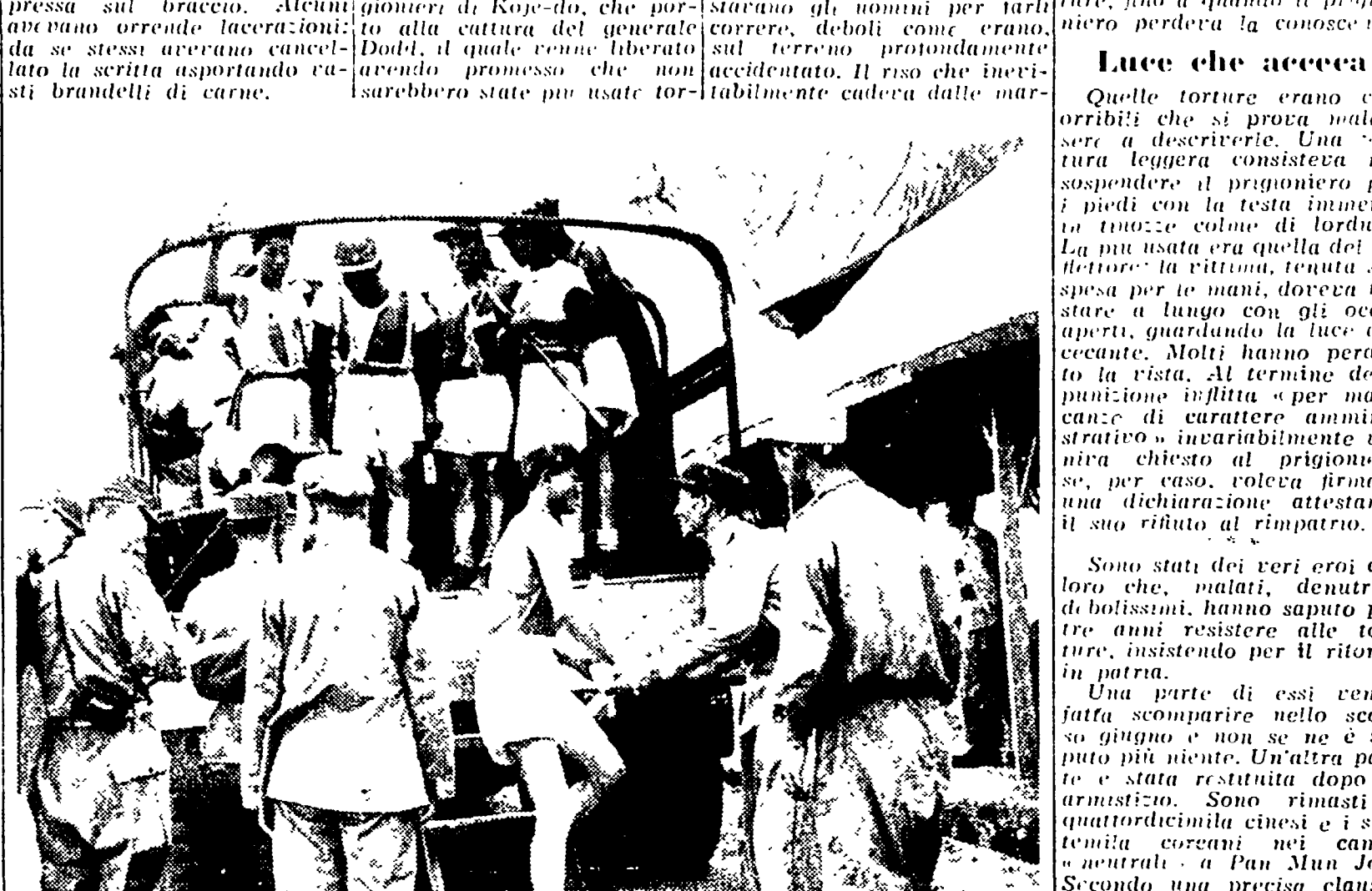
COREA - Prigionieri che tornano alle loro case, durante gli scambi dello scorso anno. Liberati dalle odiose imposte loro imposte dall'aggressore, i reduci manifestano gioia e commozione per l'imminente rimpatrio.

«Una parte di essi come fatta scomparire nello scorso giugno e non se ne è saputo più niente. Un'altra parte è stata restituita dopo lo armistizio. Sono rimasti i quattrocento cinesi e i settanta coreani nei campi neutrali a Pan Mun Jon...»