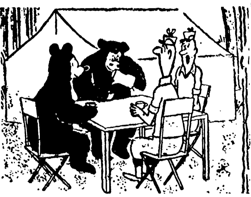
— Ma io credevo che lei avessi invitato tu!