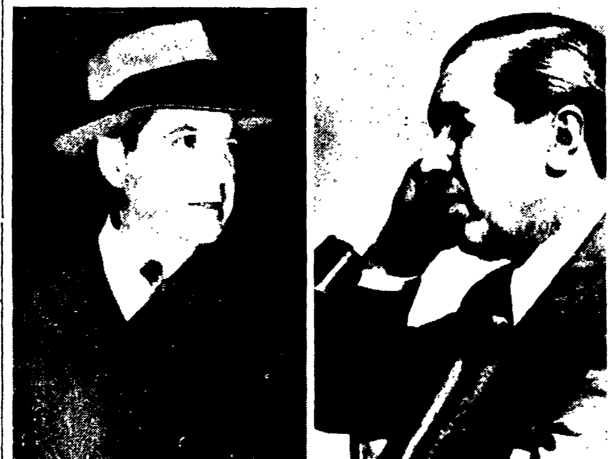
Joe Adonis (a destra) e Frank Costello, due tra i massimi esponenti della malavita in USA