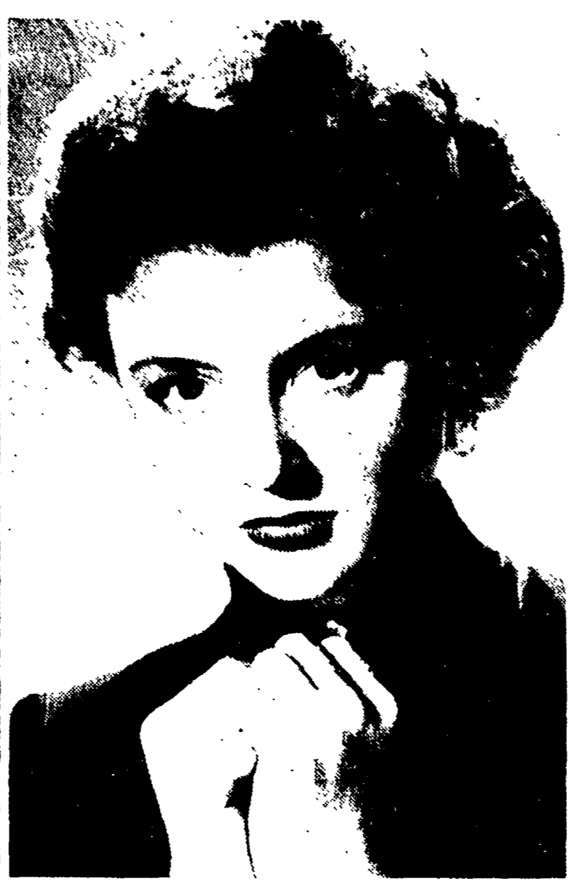
Nicole Courcel è la gradita protagonista del film francese...