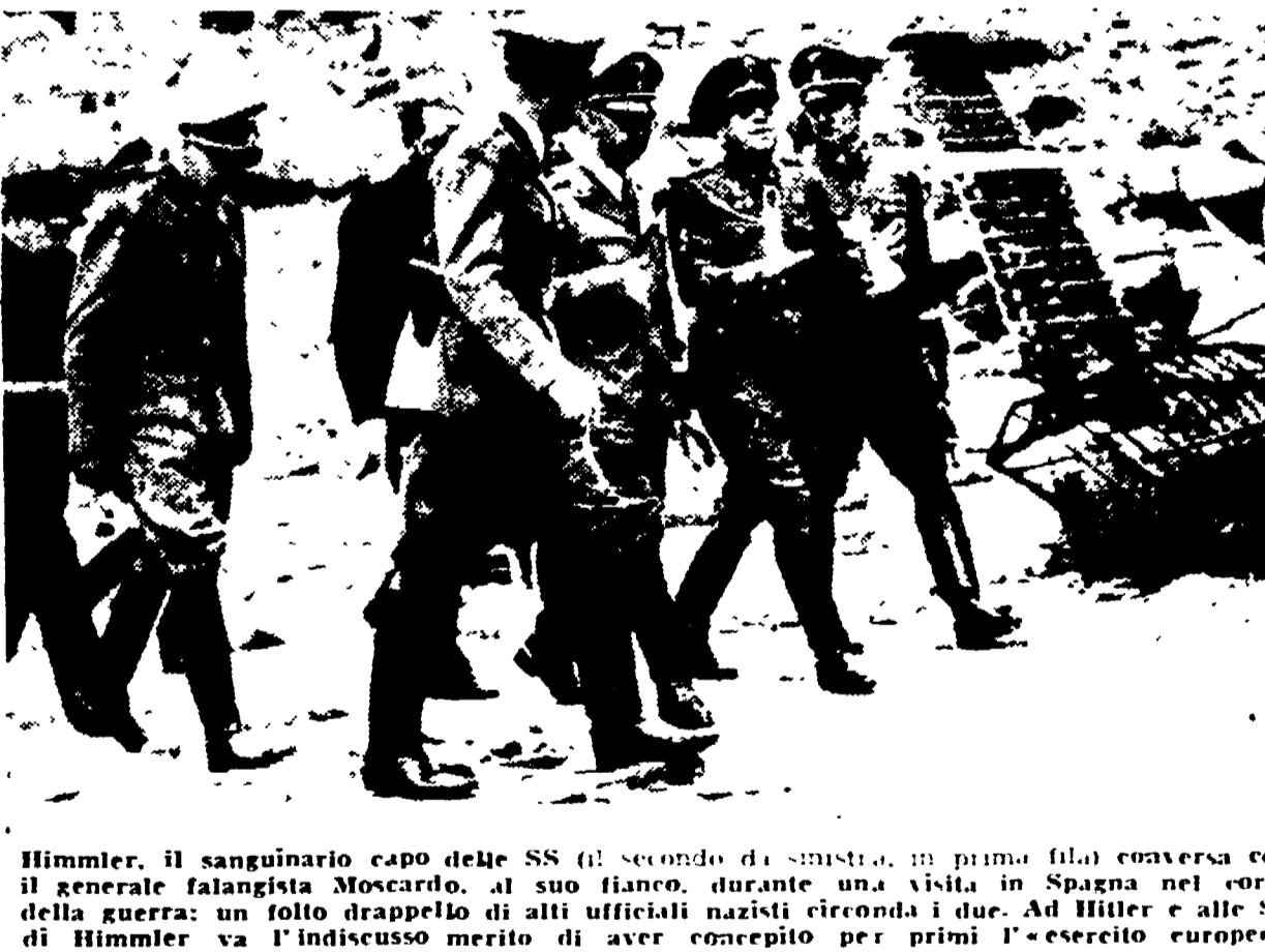
Himmler, il sanguinario capo delle SS (il secondo da sinistra, in prima fila) conversa con il generale fantagista Moscarda...