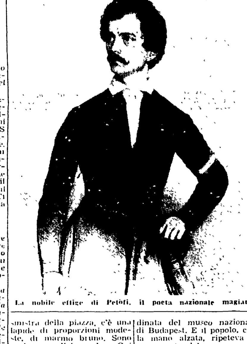
La nobile etette di Petöfi, il poeta nazionale magiaro