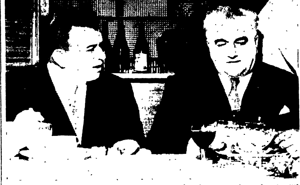
BOLOGNA - In occasione del Festival teatrale, che si svolge in questi giorni nella città emiliana, è stato offerto un pranzo alla compagnia di Gino Cervi...