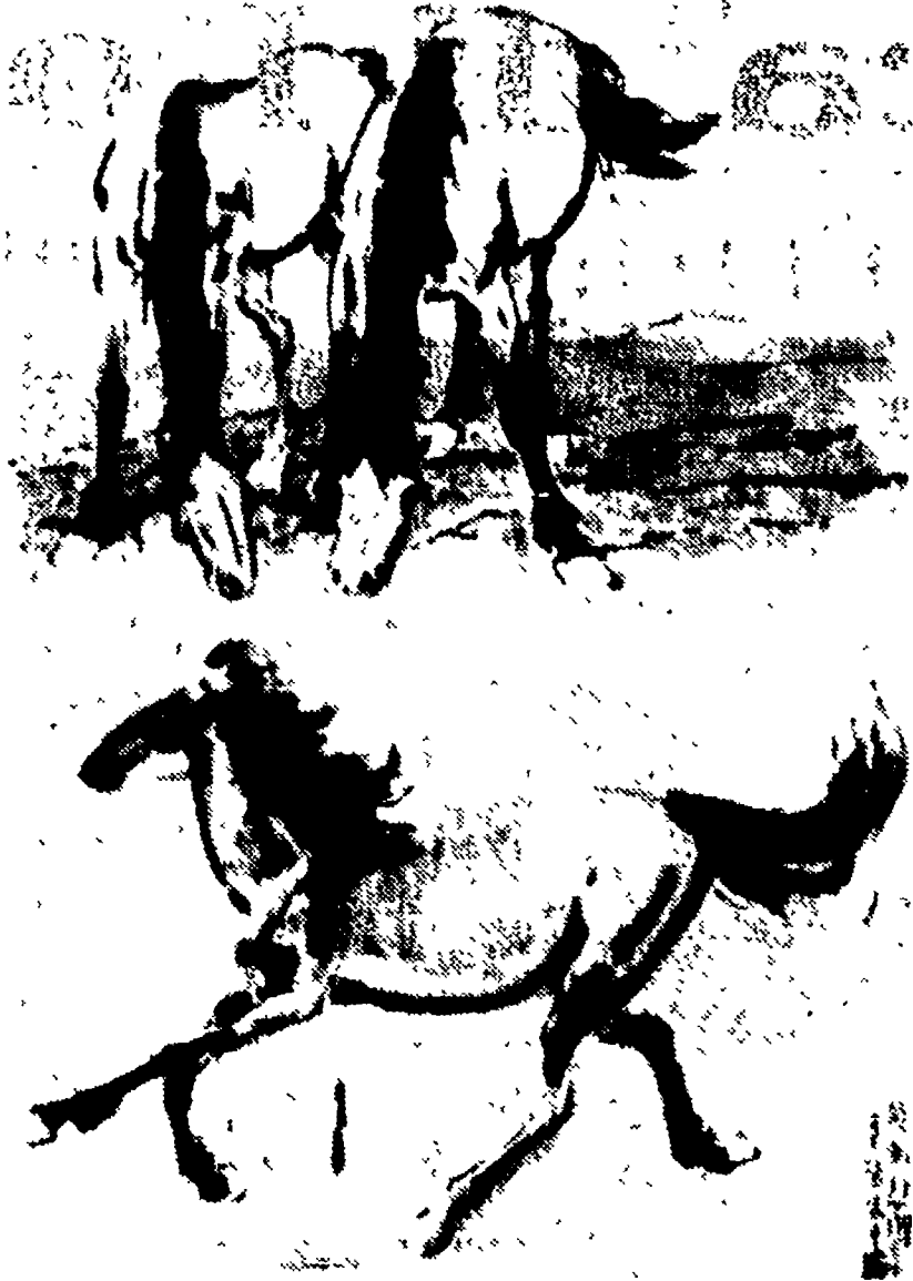
Oggi martedì, alle 18, presso il Circolo romano di cultura, in via Emilia 25, si terrà una proiezione con illustrazioni di una diaffilm a colori dal titolo «Venti secoli di pittura cinese»...