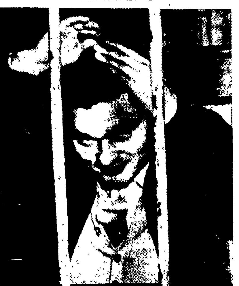
Il bandito Angelo Russo fotografato durante il grande processo di Viterbo