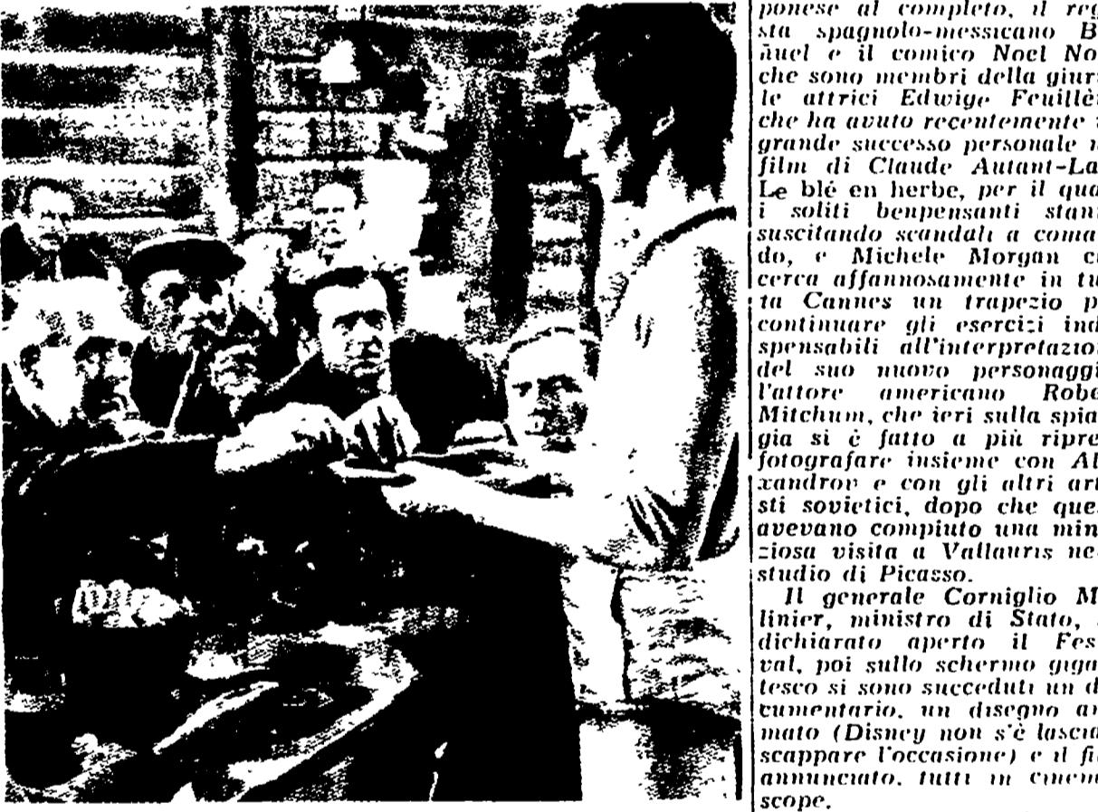
Una scena del film di Vladimir Vleck «I commedianti», il più notevole della selezione cecoslovacca, presentata a Cannes

polacco di Chopin, porta al Festival la sua ultima produzione. I cinque della via Barska. L'interesse di questa opera consiste nel fatto che affronta il problema della lingua giovanile.