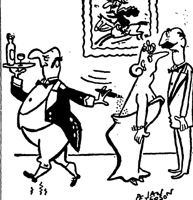
«Battista non è più lo stesso da quando ha vinto al Totocalcio...»

Avvicinati l'indice al verde... «Povera Nora, — esclamai, — mi par di vederla ancora lì...»