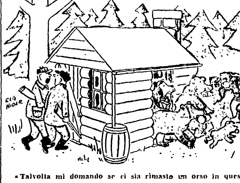
«Talvolta mi domando se ci sia rimasto un orso in questi boschi...»