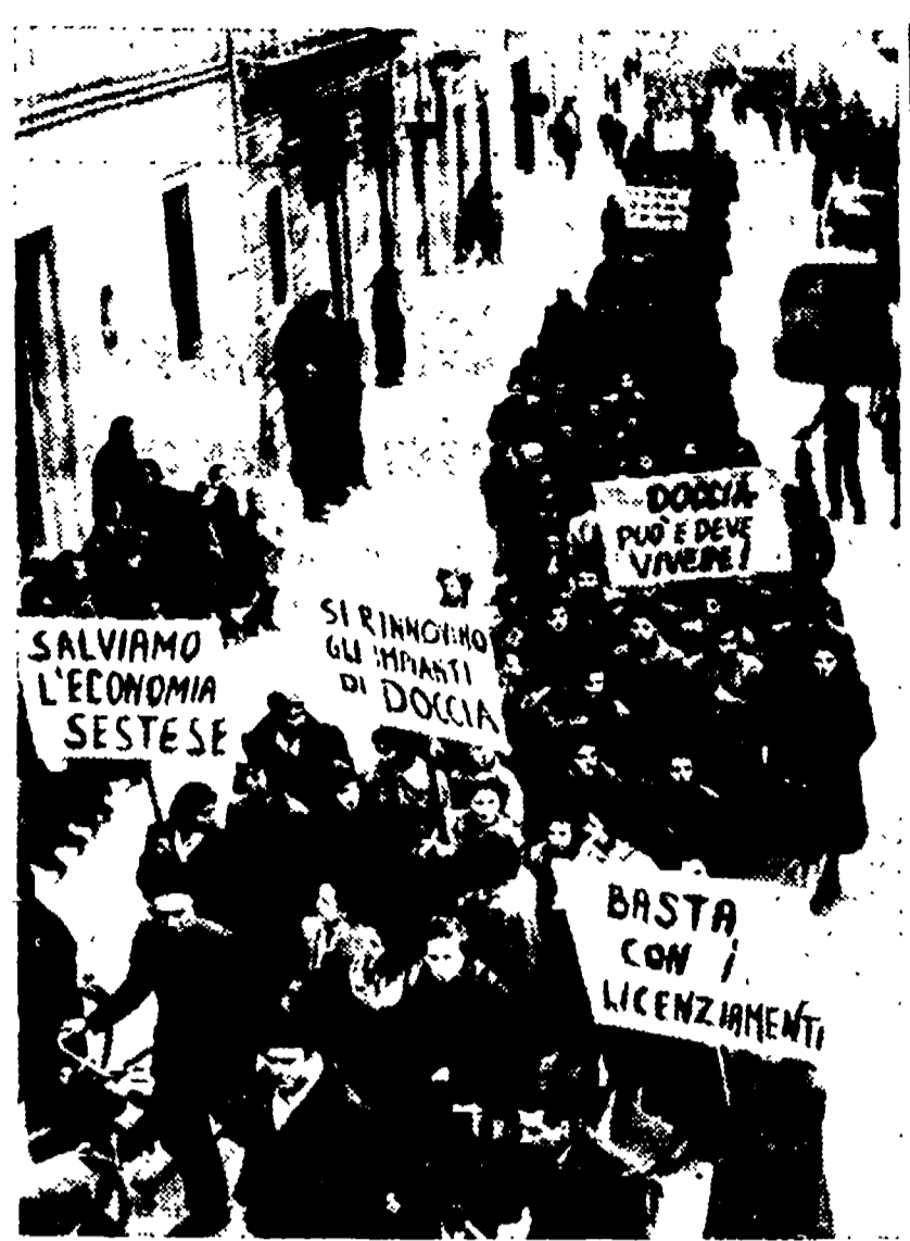
FIRENZE - L'aspetto di una delle manifestazioni condotte lungo le vie del capoluogo toscano dal 937 di Doccia, in lotta per la salvezza della loro fabbrica minacciata di chiusura

Dopo la assemblea di Assisi dell'A. C. - Le accuse circostanziate di Don Maccari - La paura dell'incontro tra i giovani di diverse tendenze - L'urgenza delle questioni sociali