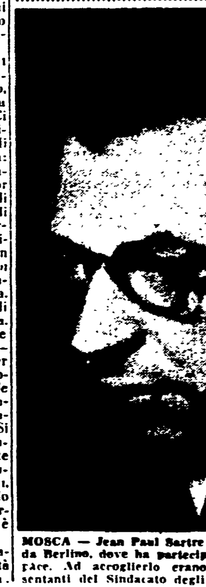
MOSCA - Jean Paul Sartre è giunto nella capitale sovietica da Berlino, dove ha partecipato ai lavori del Consiglio della pace.