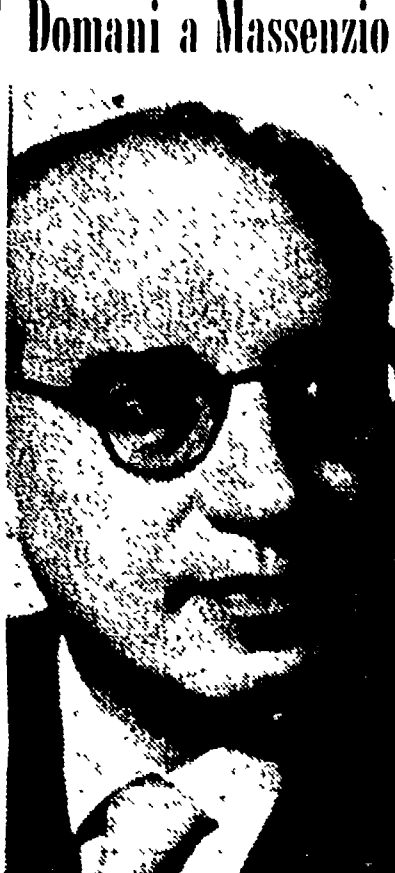
Domani a Massenzio