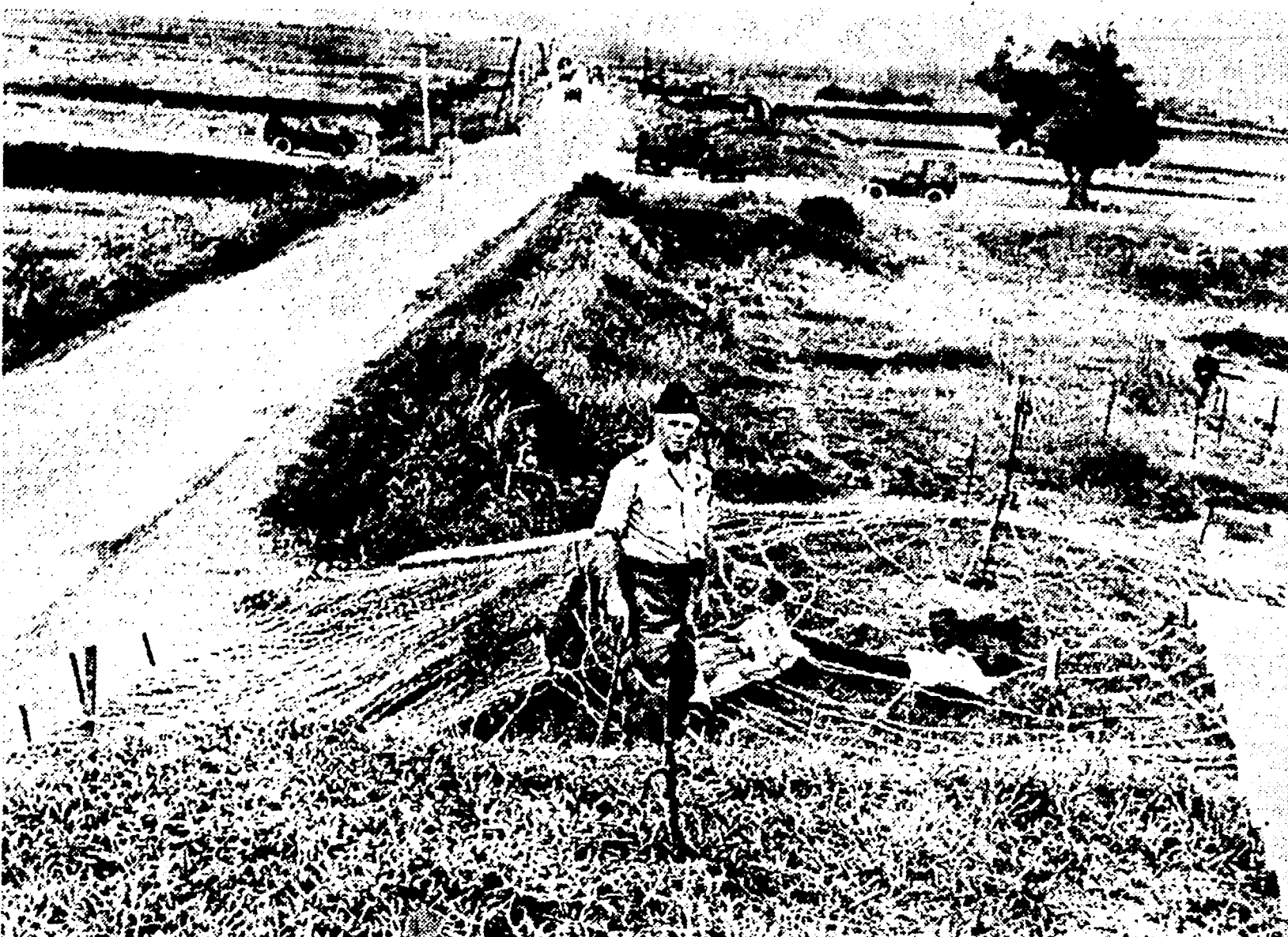
VIET NAM — Il Delta del Fiume Rosso è la regione del Viet Nam dove più aspramente, in questi giorni, l'esercito popolare e i partigiani fanno sentire la loro pressione sulle forze imperialiste francesi. La stragrande maggioranza della superficie del Delta, è ormai sotto il controllo dei vietnamiti di Ho Chi Min. Le truppe francesi e mercenarie sono costrette entro i limiti di alcuni capisaldi. Il traffico fra di essi è impossibile di notte e grandemente ostacolato di giorno. Nella foto in alto a sinistra: mitragliatrici francesi e un largo schieramento di reparti colonialisti proteggono il traffico militare a un crocivia della strada n. 81 a 10 chilometri da Hanoi. Nella foto in alto: una postazione francese protetta da reticolati su una strada del Delta. La sentinella è costretta a vigilare dentro i reticolati