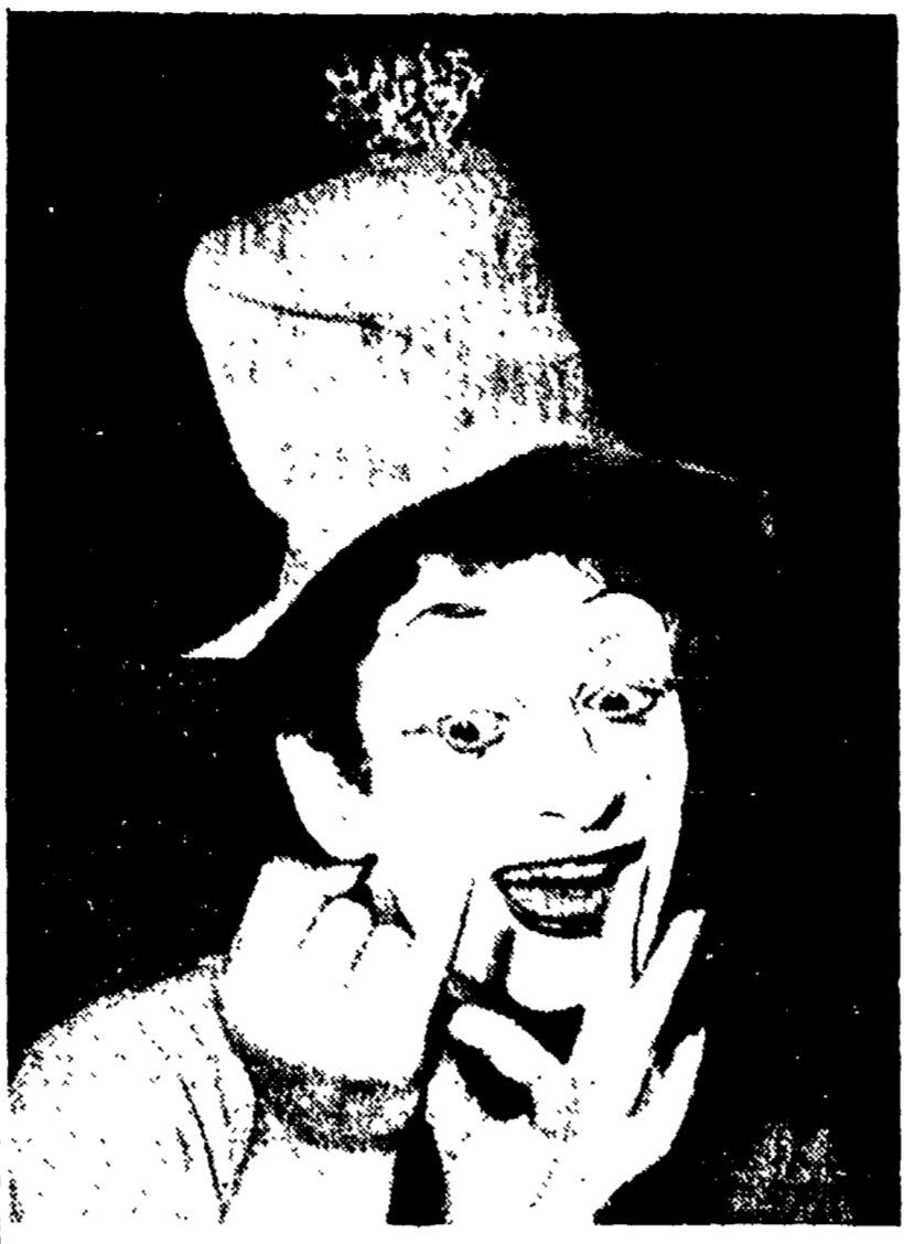
PARIGI — Marcel Marceau, lo straordinario mimo francese. Fa tutto la sua « rentrée » nella capitale dopo un ampio giro in Europa...