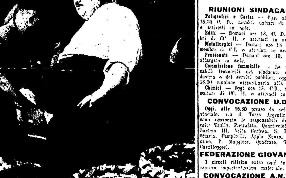
Le ceste piene, la mattina all'oroscuro: sta per cominciare il lavoro

L'insieme dei servizi è costituito da un ufficio tabaccai, un ufficio postale e telefonico, alcuni uffici amministrativi, un barbiere, due banche, la sede dei vigili comunali. Un ambulatorio del medico, un ufficio di polizia, un ufficio di pubblica sicurezza, un ufficio di pubblica sicurezza, un ufficio di pubblica sicurezza, un ufficio di pubblica sicurezza.