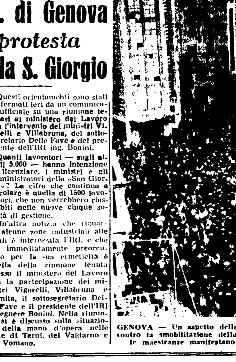
GENOVA — Un aspetto delle grandi dimostrazioni di ieri contro la smembratura della S. Giorgio. Nella foto: le maestranze manifestano sotto la sede dell'azienda