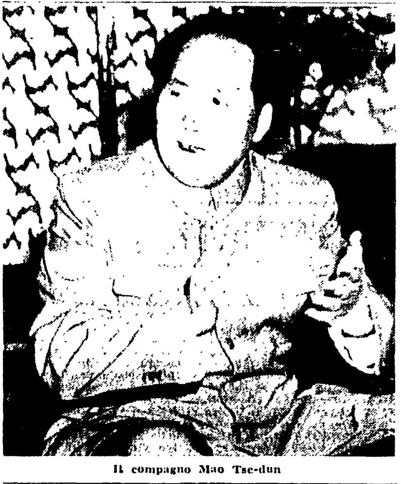
Il compagno Mao Tse-dun