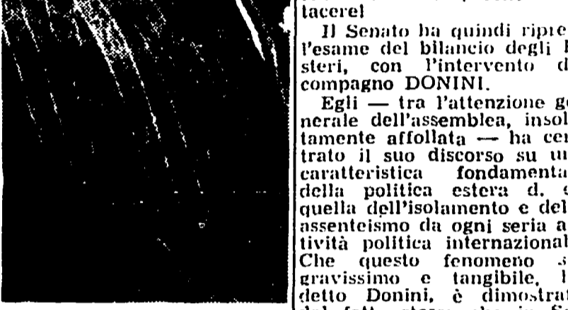
Il compagno Donini

Con un discorso del compagno Donini di critica a fondo della politica estera seguita dal governo e con un documentato intervento del compagno Mancino sui problemi dell'emigrazione, si è conclusa ieri sera al Senato la discussione generale sul bilancio degli Esteri.