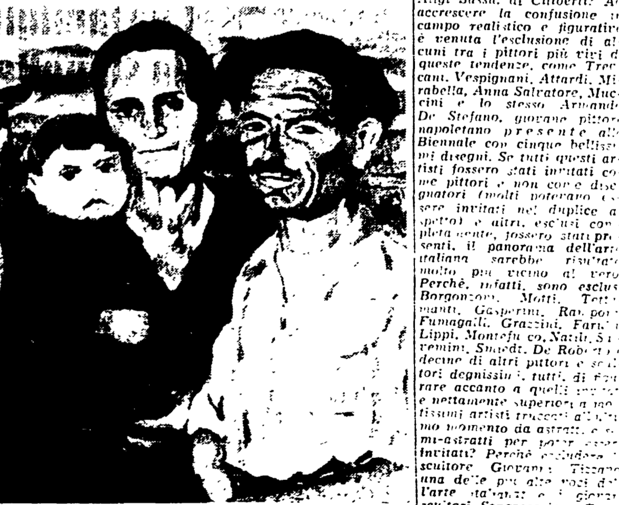
CARLO LEVI: « Famiglia con talina »