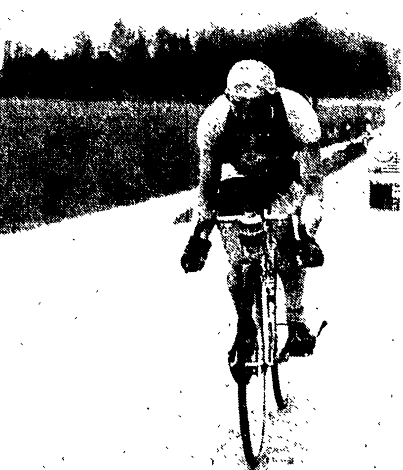
L'olandese Wout Wagtmans, vincitore della tappa di ieri, è la prima maglia gialla del Tour 1954

Uno scatto di Koblet, poco esaltante, non è stato di Huber che era partito a far gli occhi, da battistrada, ha messo tutti in allarme, e Marcel Bidot non ha esitato, per evitare una brutta sorpresa, a lanciarsi dietro ai due svizzeri Geminiani e Forrester.