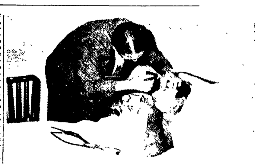
Il dott. Fratini al capezzale di Coppi

MILANO. 8 - Le conseguenze della caduta di Fausto Coppi, avvenuta ieri durante un allenamento nei pressi di Pavia, si sono rivelate più gravi di quanto non fossero apparse in un primo tempo. Subito dopo l'incidente, Coppi è stato condotto a Milano e il primo referto medico si riferiva ad abrasioni e contusioni superficiali. Lo stesso informatore non escludeva però la possibilità di un trauma cranico, con fratture al collo e alla nuca.