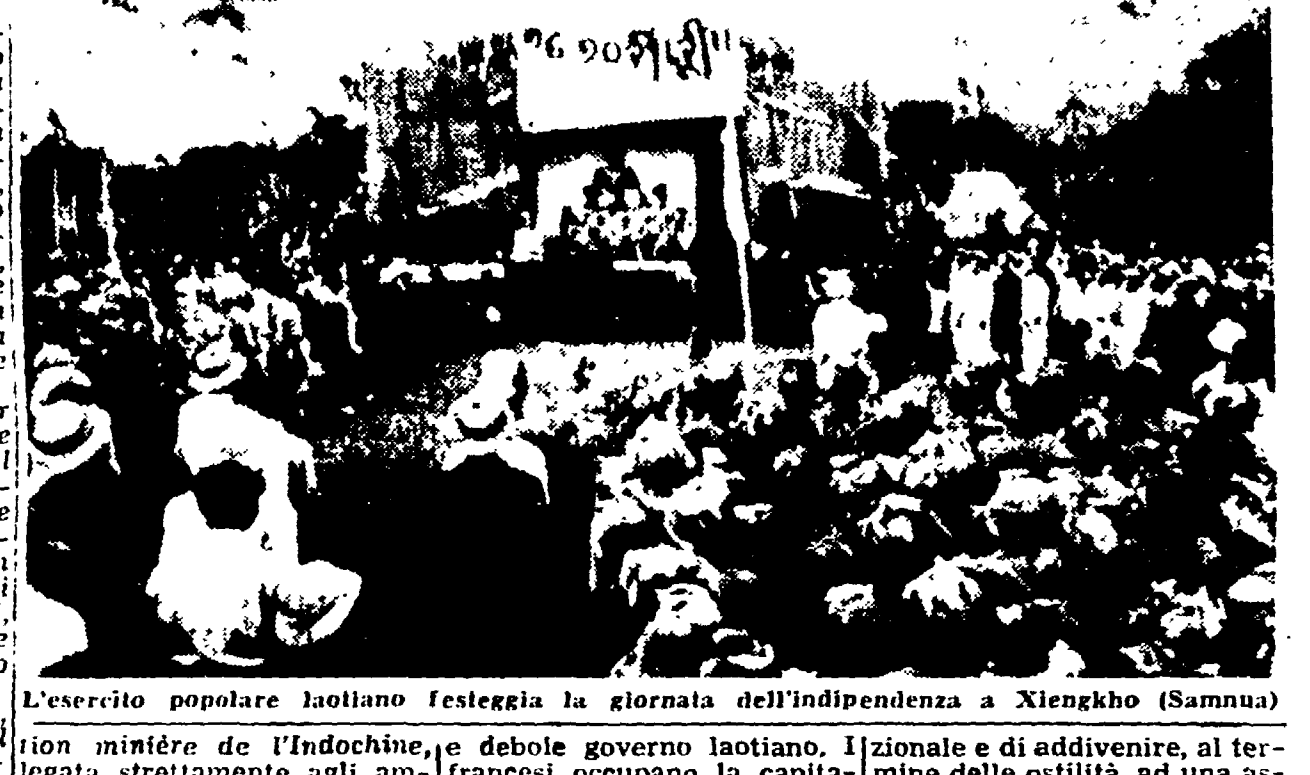
L'esercito popolare laotiano festeggia la giornata dell'indipendenza a Xiengkho (Samnua)