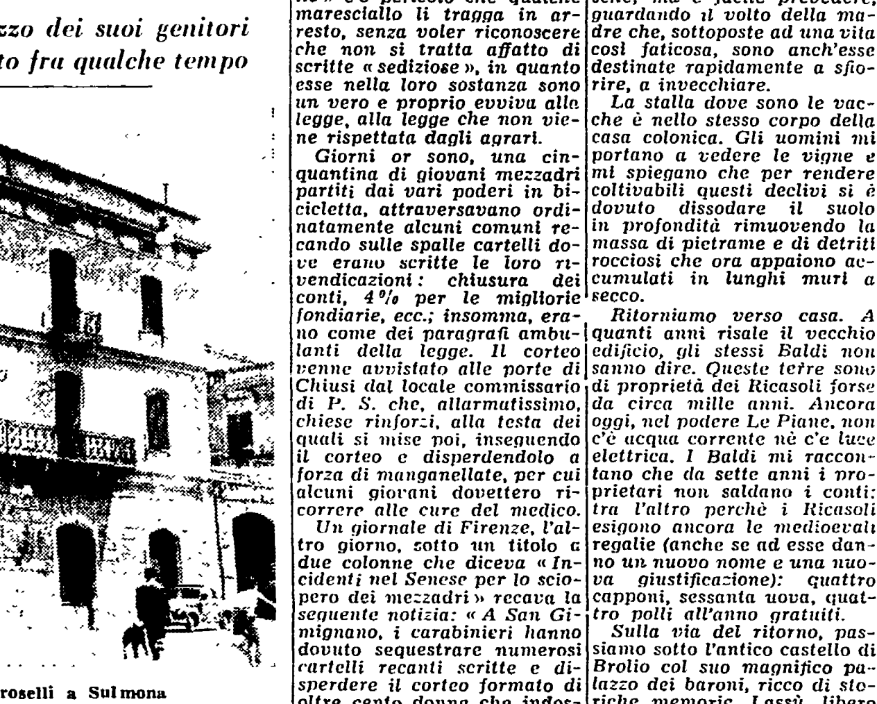
La casa natale della contessa Pia Bellentani Caroselli a Sulmona

Un folto gruppo di giornalisti e fotografi staziona di fronte al palazzo dei suoi genitori - Per espresso desiderio della contessa le figlie la raggiungeranno soltanto fra qualche tempo