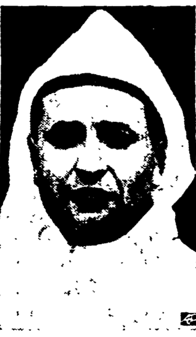
Mohamed ben Yusef

Conclusa la prima fase del dibattito sul patto asiatico, il Portogallo, a proposito dei possedimenti coloniali portoghesi sul territorio indiano, ha annunciato che si annuncia che sarà organizzata a Goa una manifestazione di resistenza passiva contro l'oppressione coloniale portoghese.