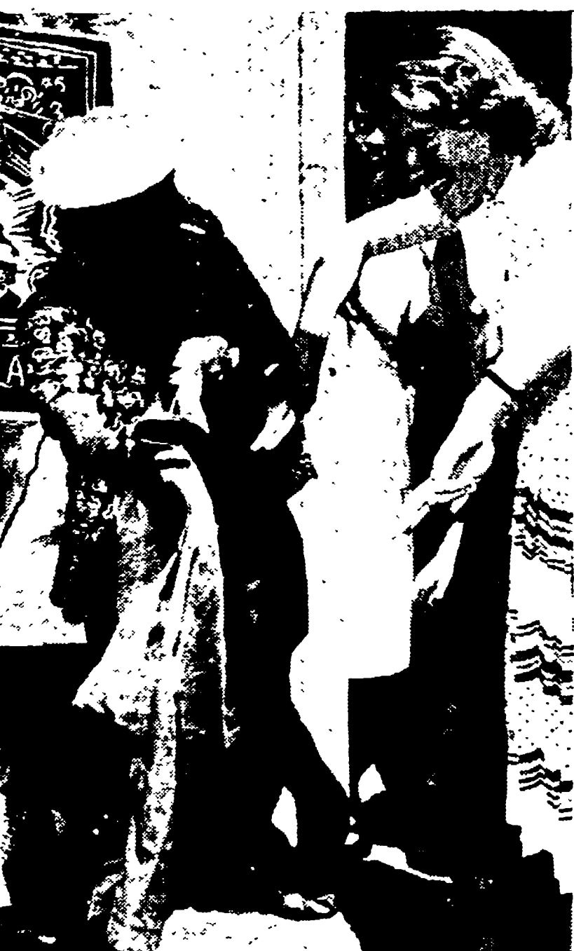
PICASSO A VALLAURIS — Il grande pittore si esibisce in una scherzosa parodia di corrido con una bella brètonne