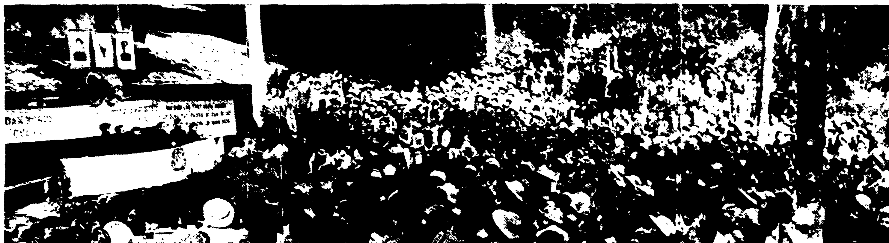
LA PACE TORNA NEL VIET-NAM — In entusiastici comizi tenuti nel folto delle boscaglie indocinesi i distaccamenti partigiani apprendono la notizia dell'armistizio stipulato a Ginevra