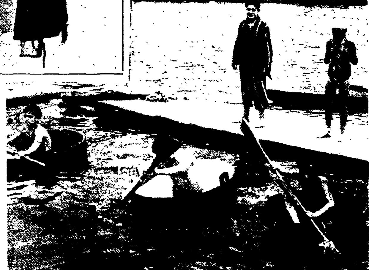
LA CORSA DELLE BOTTI Tra i bimbi tedeschi sembra che sia uno sport in voga