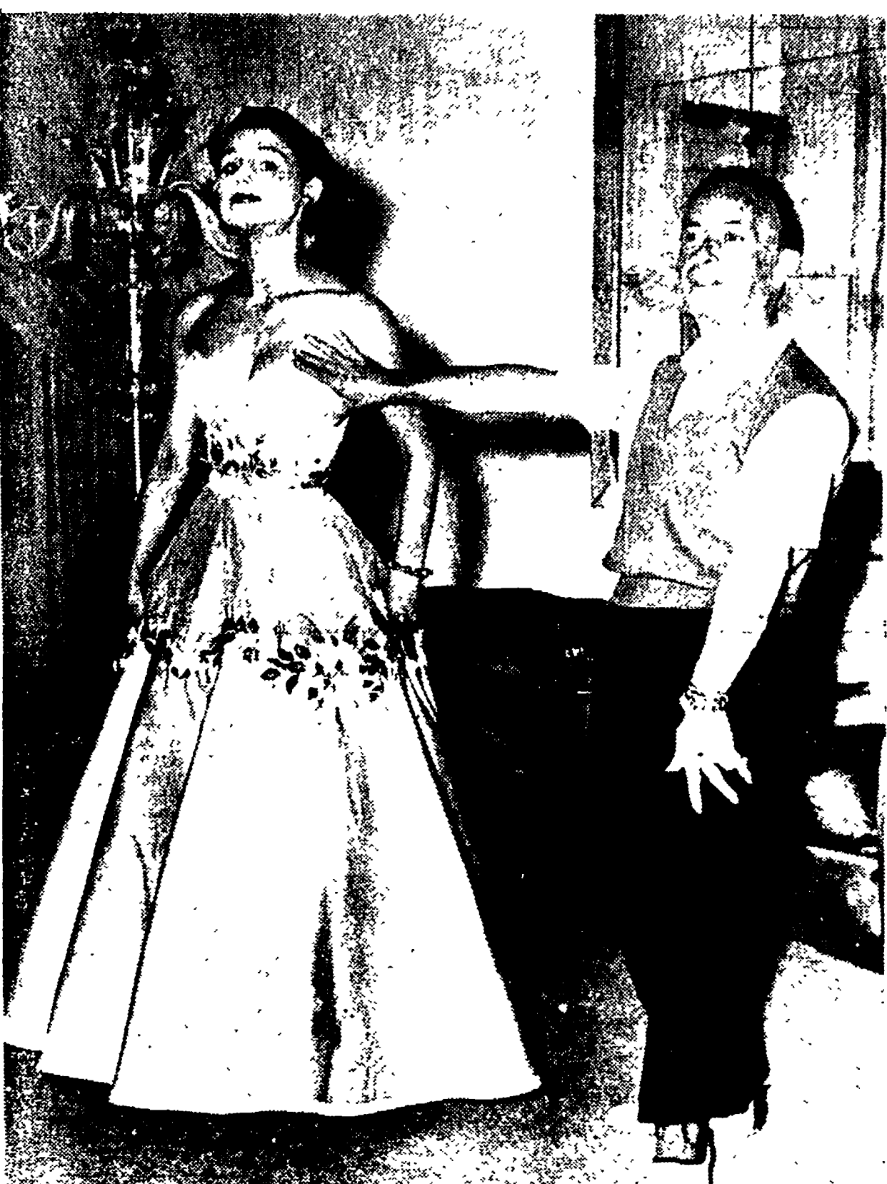
LINEA CURVA E LINEA PIATTA — In polemica con il sarto parigino Christian Dior, fautore di un ritorno alla «donna-crisi», il sarto Schubert, che lavora a Roma, intende mettere in forte rilievo nei suoi modelli le caratteristiche femminili: la chiameremo «linea Lollo»?