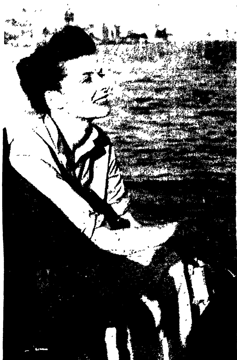
ATTRICI FAMOSE A VENEZIA — Questa è Katherine Hepburn, in motoscafo sulla laguna, in una pausa della lavorazione del film «La storia del cuco»