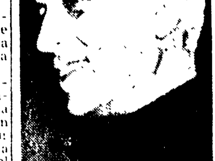
Ferruccio Parri, vice comandante del Corpo Volontari della Libertà e presidente del Consiglio del primo governo di C.N., ha pronunciato un commosso discorso commemorativo alle famiglie dei caduti.

Il feroce massacro di donne e bambini inermi che si erano rifugiati nelle capanne del Padule il 25 agosto del 1944