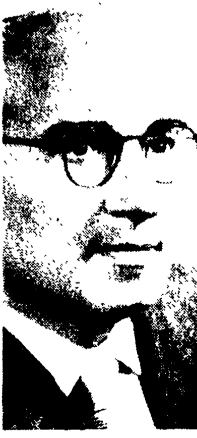
Il compagno Scoccimarro

Le congratulazioni di Togliatti ai compagni di Reggio Calabria che hanno superato l'obiettivo per la sottoscrizione