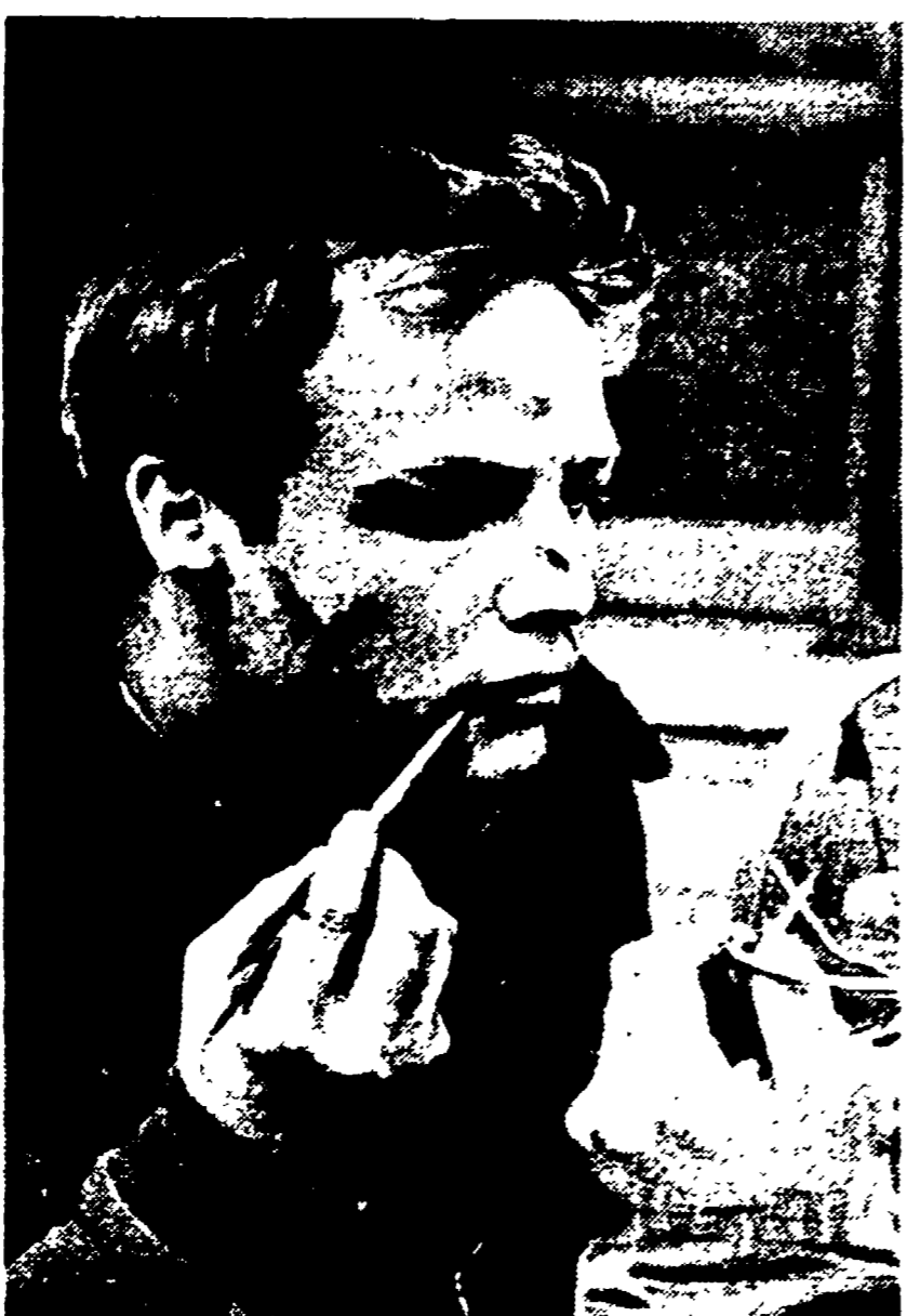
Marlon Brando si prepara per una scena di «Waterfront»