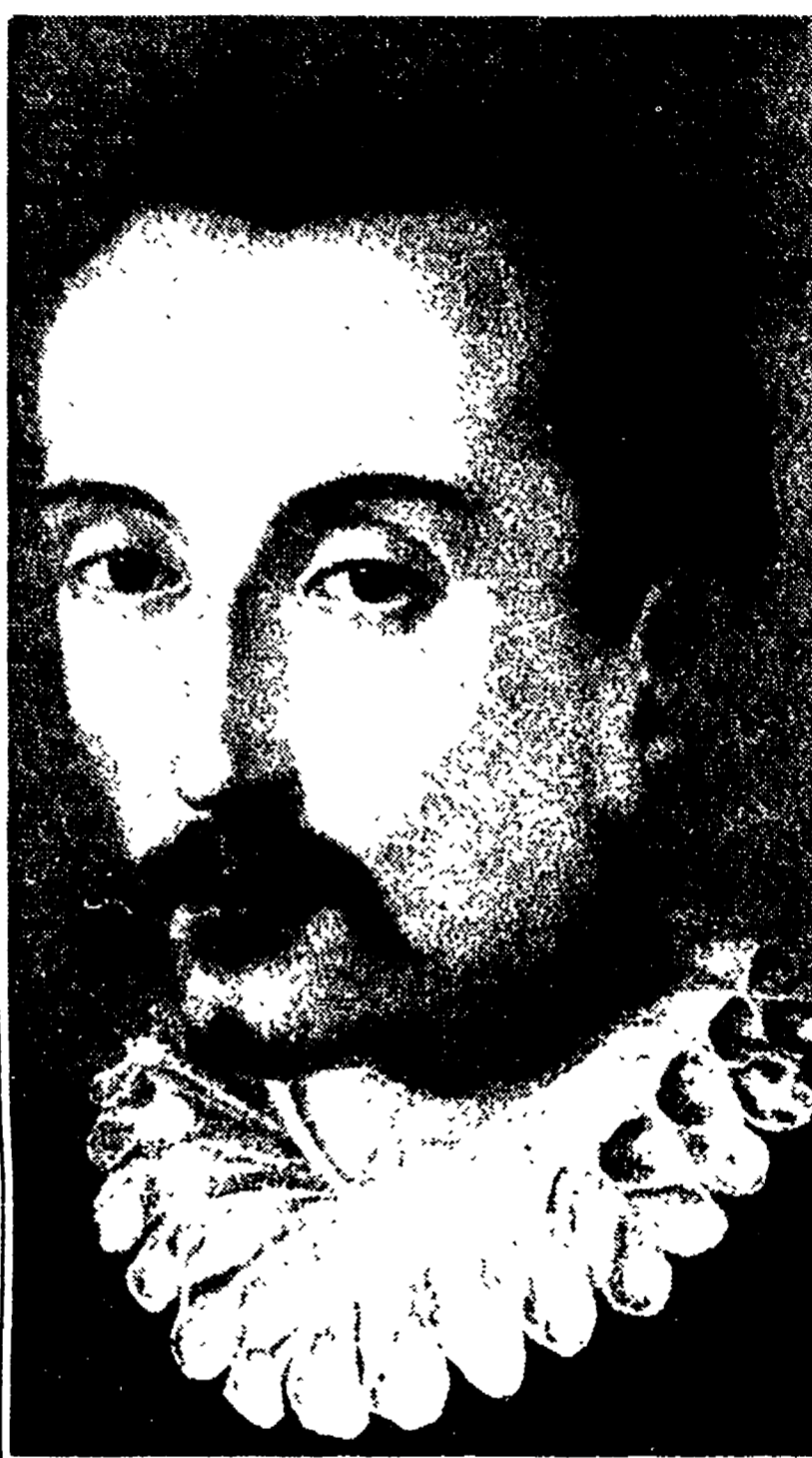
Torquato Tasso in un dipinto dell'epoca, opera dell'Allori