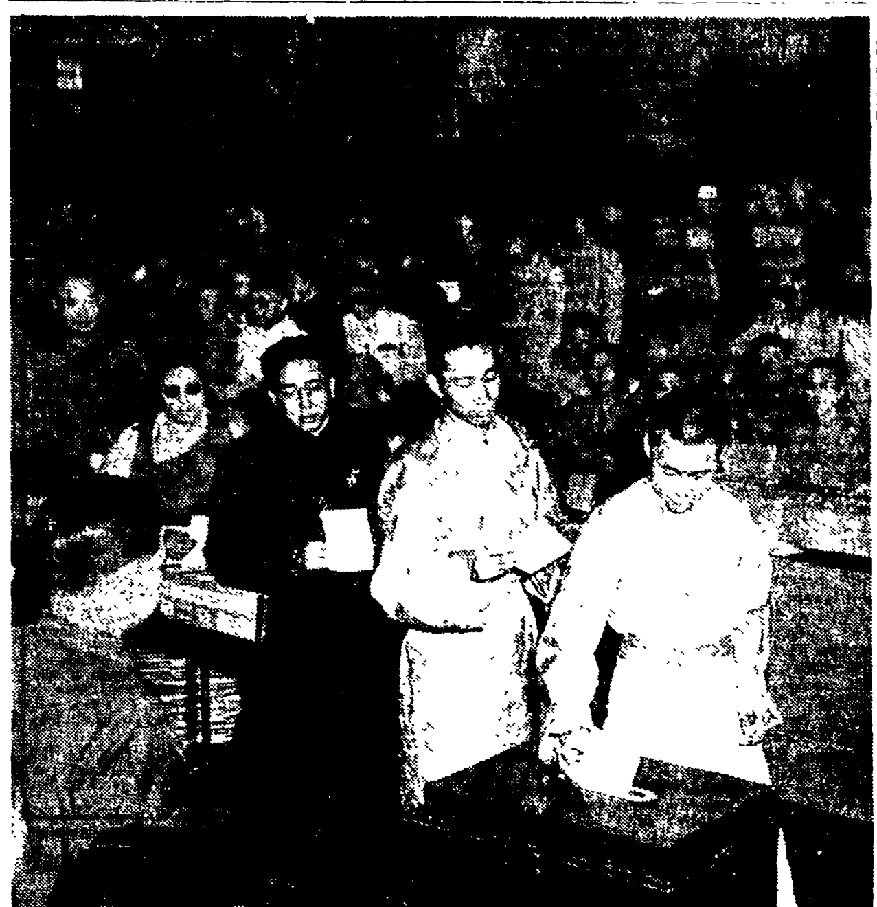
PECHINO — Alla recente sessione del Congresso nazionale popolare cinese: il Dalai e il Fanchen Lama, deputati del Tibet, votano a favore del progetto di Costituzione della Cina.