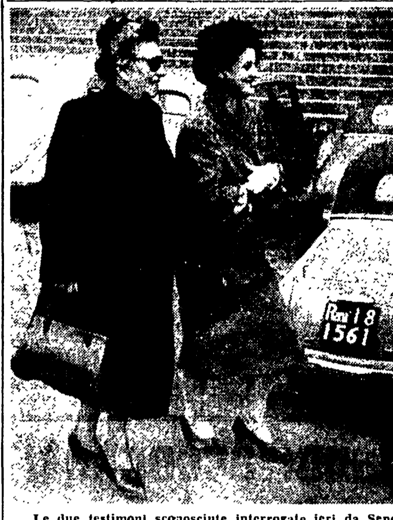
Le due testimoni sconosciute interrogate ieri da Sepe