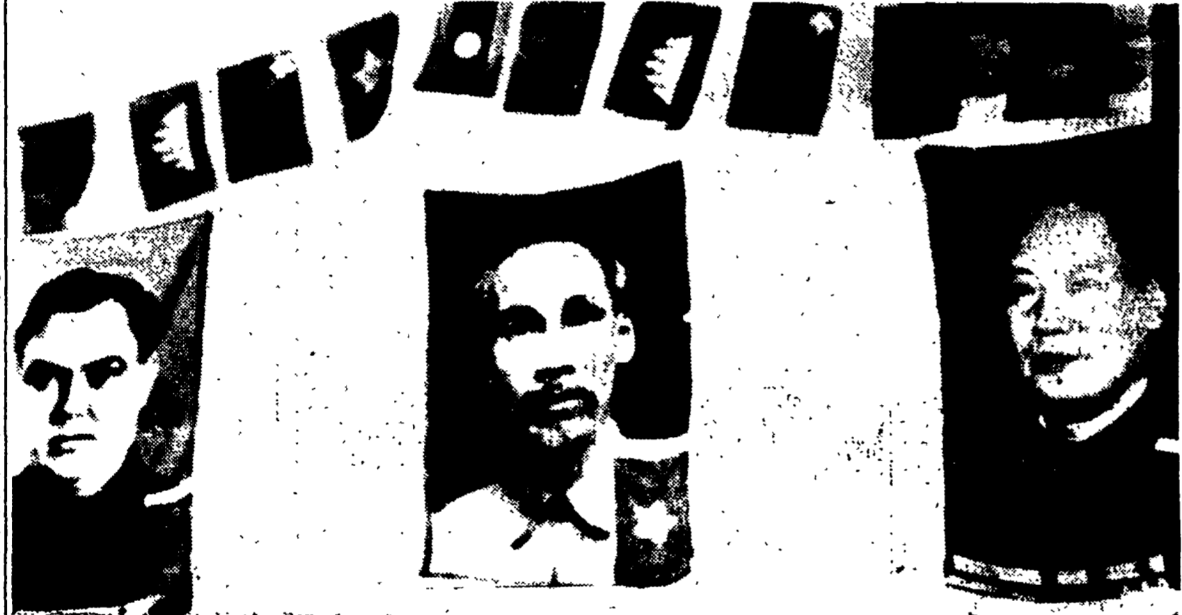
HANOI - La popolazione ha steso attraverso le strade festoni di bandiere, striscioni con parole d'ordine e grandi ritratti di Malenkov, Ho Chi Min e Mao Tse-tsun per salutare l'ingresso in città dei liberatori dell'esercito popolare.