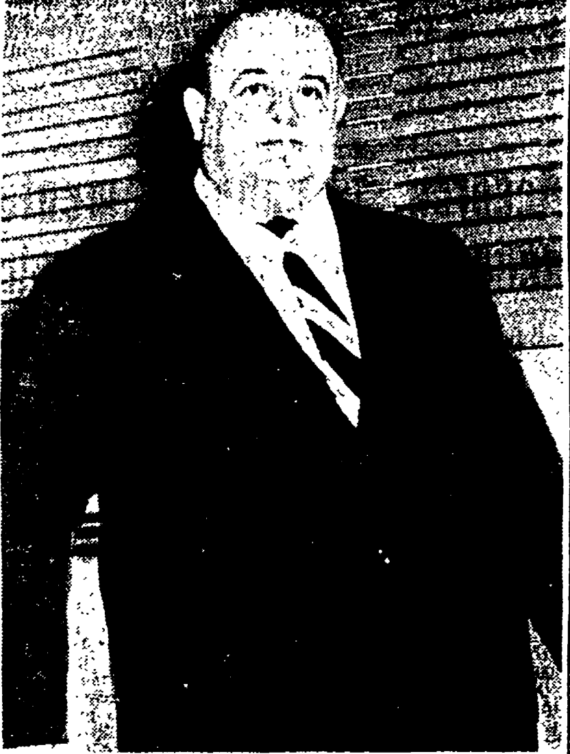
Il Presidente Sepe