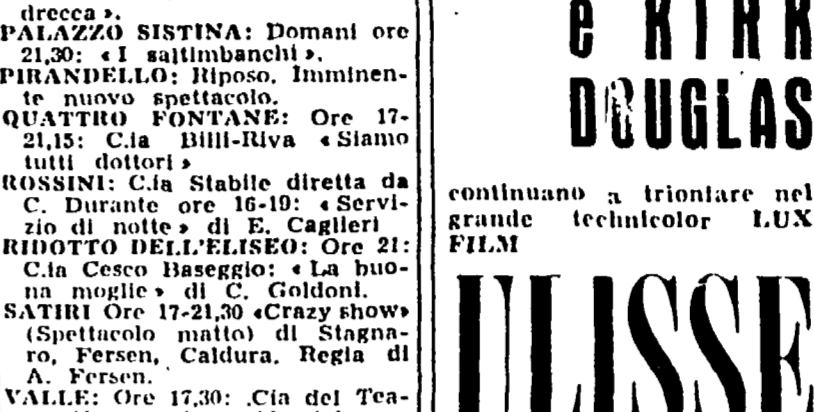
SILVANA MANGANO e KIRK DOUGLAS