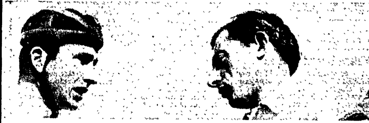
FILIPPI e COPPI una delle tre coppie favorite nel gioco del pronostico

Bobet-Anquetil, Coppi-Filippi e Koblet-Kubler si daranno aperta battaglia: chi vincerà? - Attesa la prova delle coppie di giovani: Fabbri-Zucconelli e Moser-Maule