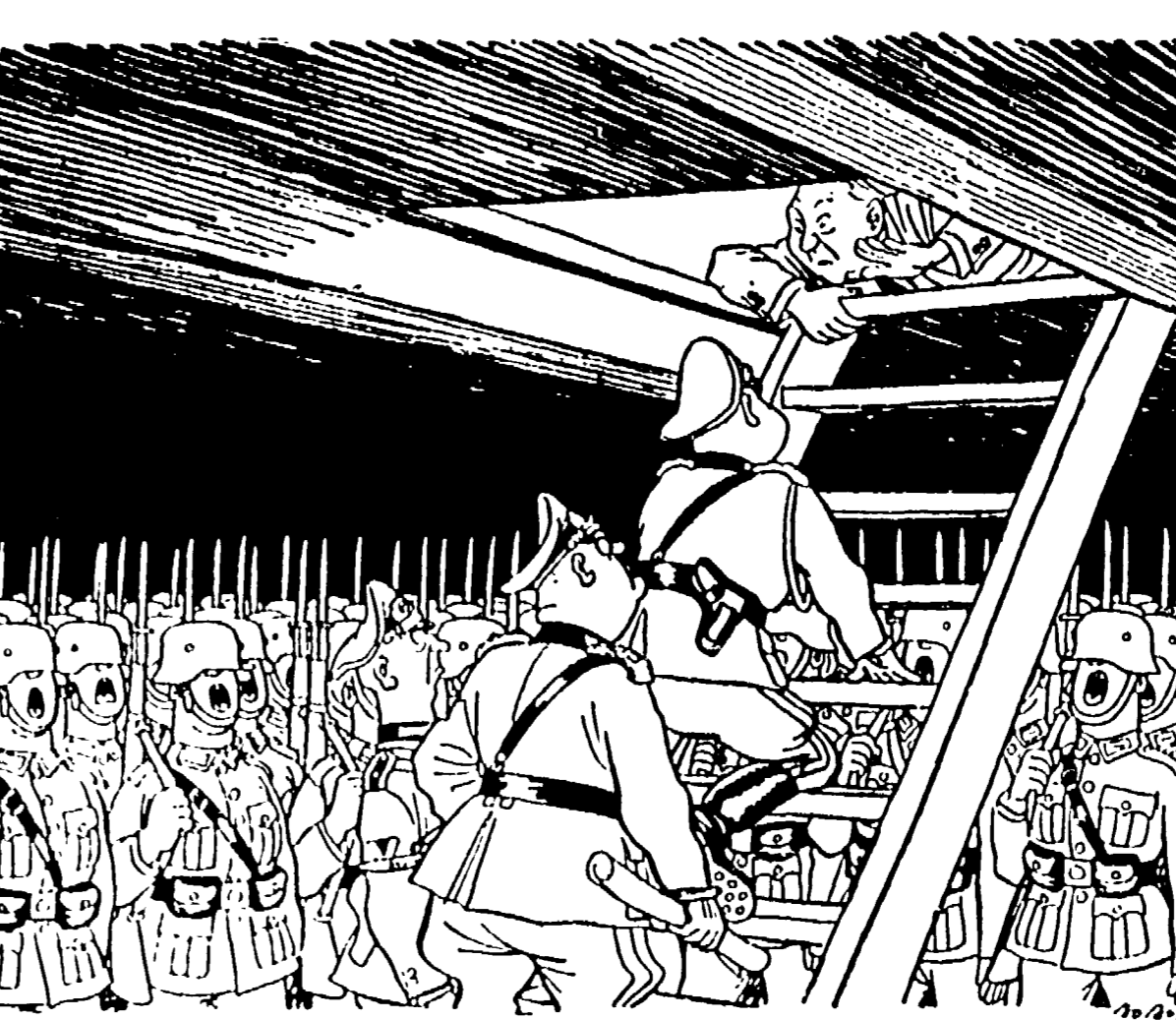
ADENAUER: «Spero, state buoni ancora qualche giorno. Dopodiché potrete uscir fuori e mostrare come siete stati addestrati a dovere...»

LE CANTINE DI BONN (Dal giornale danese «Politiken»)