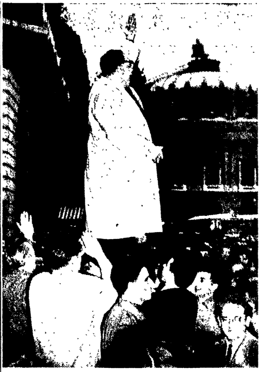
PARIGI - Pubblici funzionari raccolti a comizio in Place de l'Opera per protestare contro l'inaspettata decisione del governo francese...