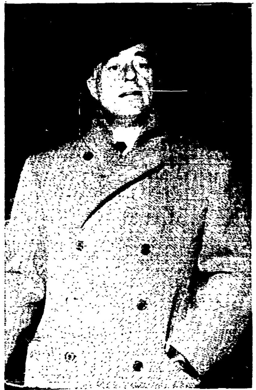
La personalità di Vittorio De Sica si rivela completamente in «L'oro di Napoli», di cui appunto De Sica è il regista inimitabile e l'interprete brillantissimo nei panni di uno squattrinato come accanito giocatore, tenuto senza un soldo dalla vecchia, sante moglie. Accanto a De Sica ne «L'oro di Napoli» vedremo altri grandi attori come Silvana Mangano, Totò, Sophia Loren ed Edoardo De Filippo