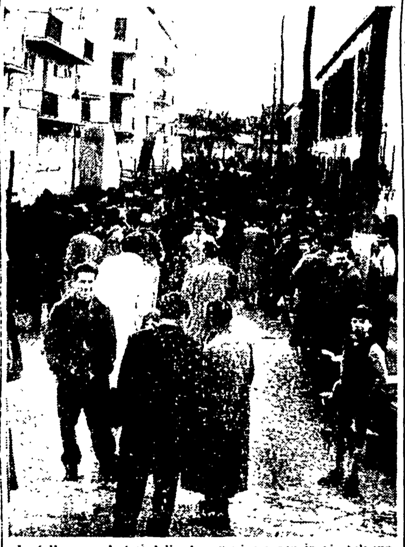
La folla segue le fasi della danza a ita serca in via Silvano

ore all'assedio della polizia. Col di fronte un'anziana casa di disoccupazione, il disoccupato si era rifugiato in un appartamento disabitato dell'ICP, sito in via Silvano a Pietralata, e vi si era barricato resistendo per molte