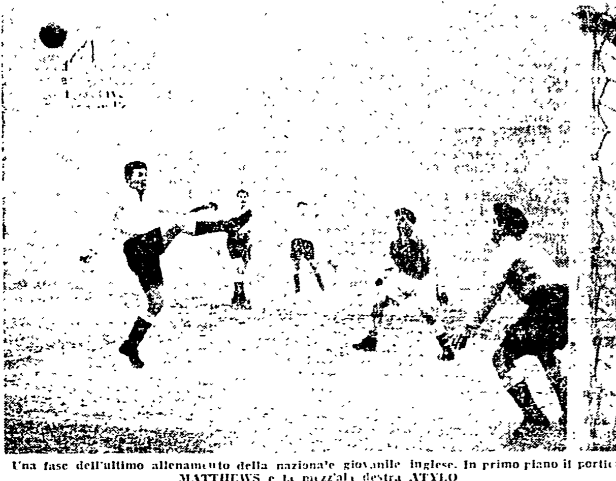
Una fase dell'ultimo allenamento della nazionale giovanile inglese. In primo piano il portiere MATTHEWS e la mezzala destra ATYHO

Studio e Gabinetto medico per la diagnosi e cura delle SOTTO FUNZIONI SESSUALI di natura nervosa, psichica, endocrina. SENILITÀ PRECOCE. NEVROSI SESSUALI. CURA. AZIONI E CURE RAPIDE PREPOTENZIANTI. ANOMALIE. Forme sbelli cure rapide radicali.